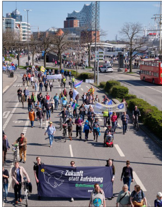
In Bewegung auf dem Ostermarsch

In Schlussfolgerung aus der Befreiung vom Faschismus ist die Universität Hamburg – als entscheidende Einrichtung für die gesellschaftliche Entwicklung – beispielgebend demokratisch aufgebaut. Im Sinne der Aufklärung dient die Universität damit der Entfaltung der Bedeutung jeder einzelnen Persönlichkeit im Ensemble. Dem können wir uns in neuem Selbstbewusstsein und assoziierter Praxis – mit Verbündeten in allen Mitgliedergruppen, an anderen Hochschulen und pazifistischer Bewegung weltweit – zuwenden.